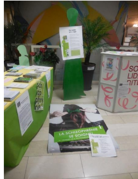
Stands d'information à l'Hôpital du Jura (Delémont) et devant le Centre Esplanade (Porrentruy) lors des 13èmes Journées de la Schizophrénie, mars 2016